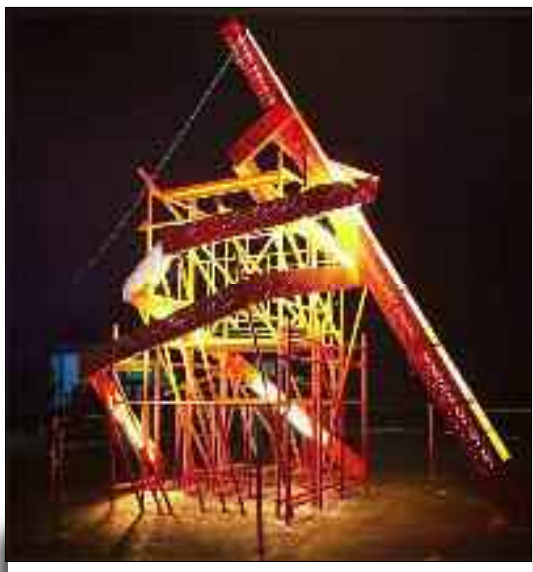
Αλλά άντε, ας τον δούμε τον «Πύργο του Τάτλιν» ως δημιουργημα τέχνης. Ποιά σχέση έχει με τα Χριστούγεννα, τις αξίες του Χριστιανισμού;

ΑΛΛΑ άντε, ας τον δούμε ως δημιουργημα τέχνης. Ποιά σχέση έχει με τα Χριστούγεννα, τις αξίες του Χριστιανισμού; Ένα σύμβολο του... παγκόσμιου επαναστατικού κινή-