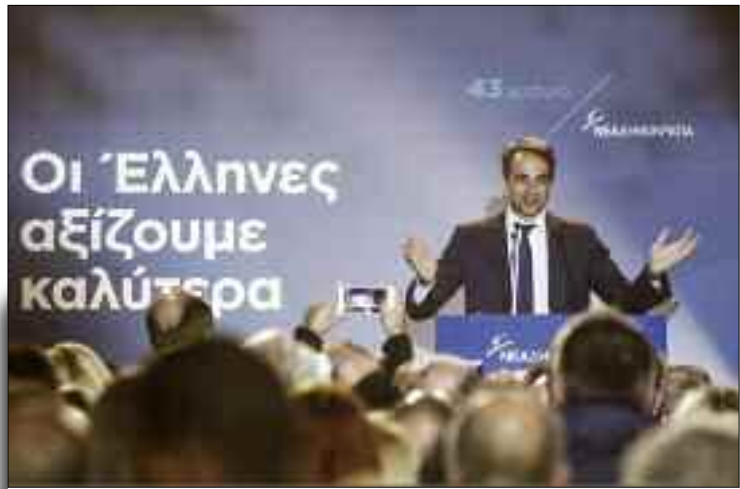
Η επιλογή του Κυριάκου Μητσοτάκη να εισάγει διαδικασίες αμφίδρομης επικοινωνίας και να χτίσει ένα ανοιχτό κόμμα, ήδη αποδίδει και δικαιώνεται

Η επιλογή του Κυριάκου Μητσοτάκη να εισάγει διαδικασίες αμφίδρομης επικοινωνίας και να χτίσει ένα ανοιχτό κόμμα, ήδη αποδίδει και δικαιώνεται. Η ενεργός συμμετοχή των πολιτών σε